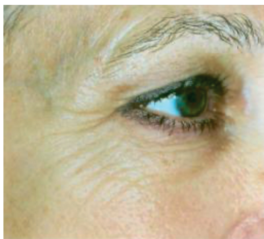
Prima dell'utilizzo di AcquaCell